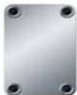
B35 Dimensions 243 x 393 mm