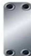
B10T Dimensions 119x 289 mm