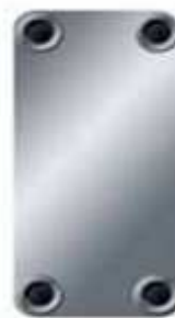
B120T Dimensions 243 x 525 mm