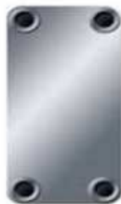
B56 Dimensions 243 x 525 mm